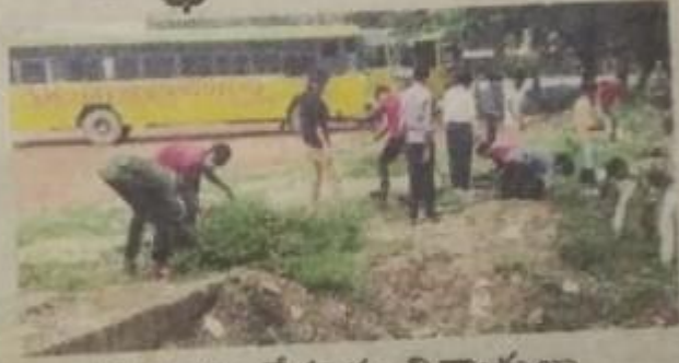
శ్రమదానం చేస్తున్న విద్యార్థులు